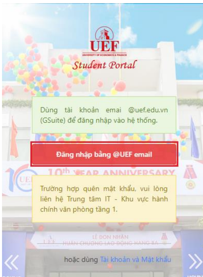
Hình 1 Giao diện đăng nhập

Trong trường hợp Sinh viên quên tài khoản Email, vui lòng liên hệ Trung tâm IT tại Tầng 4 hoặc điện thoại (028) 54226666 Ext 160 để được hỗ trợ thêm.